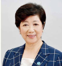
東京都知事 小池 百合子 氏 ※ビデオメッセージ