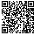
ホームページ QR コード

【Twitter】 https://twitter.com/kyushibarikyuu