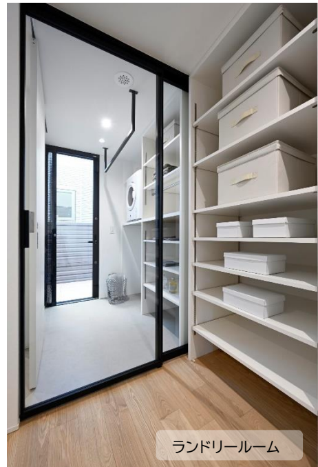
ランドリールーム