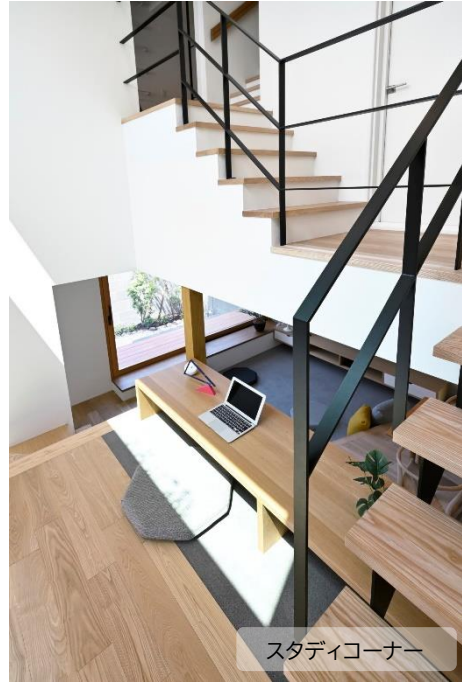
スタディコーナー