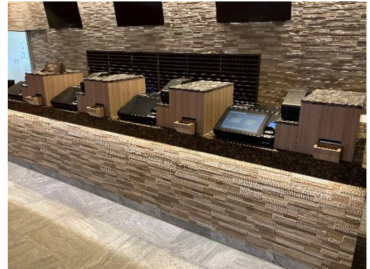
『テーブルトップ型 KIOSK』