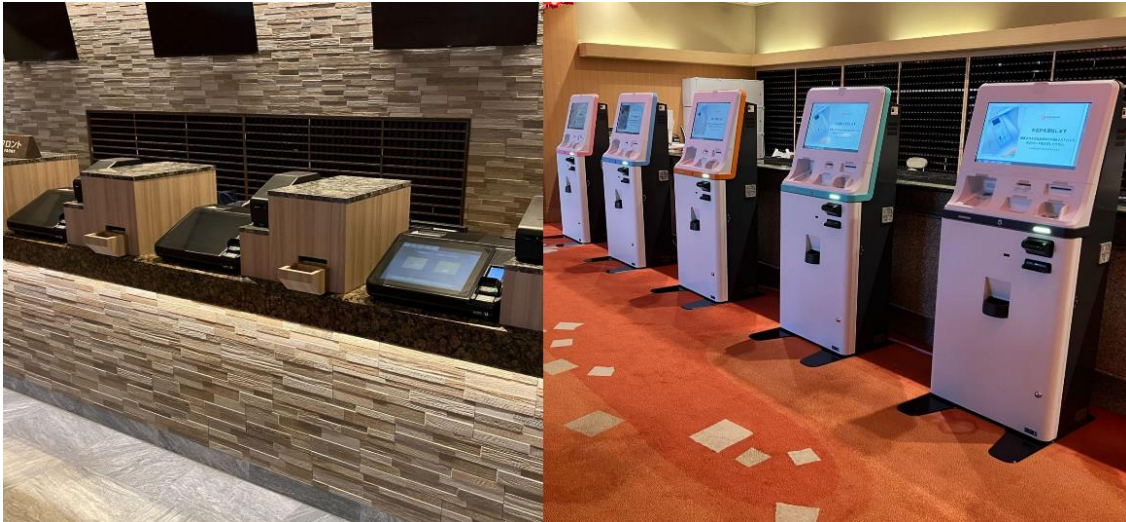
サービスサイト： 『KIOSK』 、 『FIT-A』