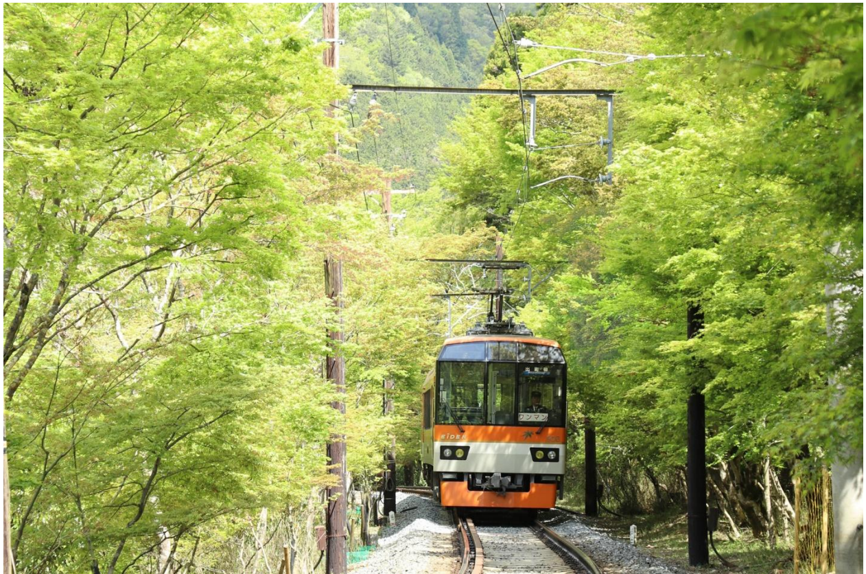
市原駅～二ノ瀬駅間「青もみじのトンネル」