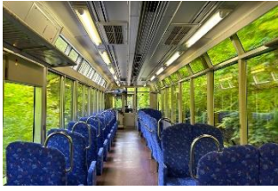
もみじのトンネル

※対象列車が市原駅～二ノ瀬駅間「もみじのトンネル」区間を通過のする際には徐行運転いたします。