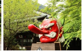
鞍馬駅前の大天狗