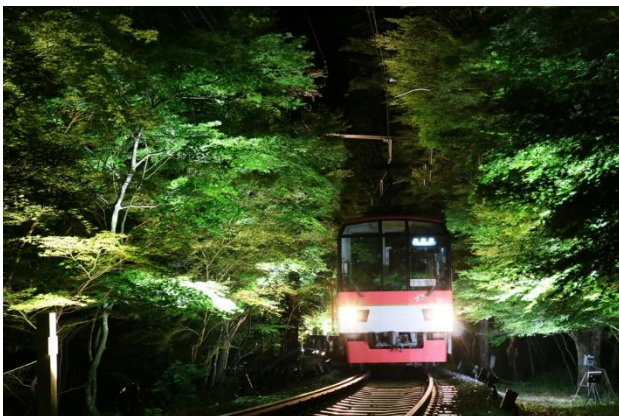
「青もみじ新緑のライトアップ」過去開催時の様子