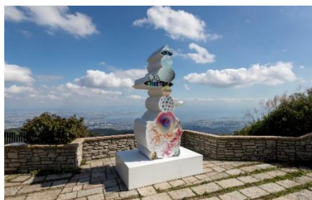
植松琢磨《world tree II》 2019年 六甲ガーデンテラス

六甲山のエリア特性をじっくりと読み込み、自然や景観、歴史を採り入れた作品を各会場に展示します。