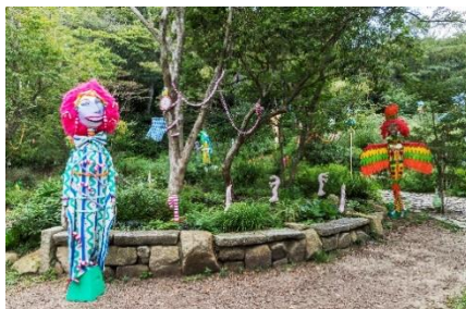
秦まりの《MAHOU NO MORI》 2019年 六甲オルゴールミュージアム