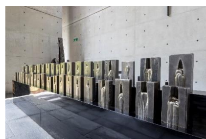
榎忠《End Tab (エンドタブ)》 2019年 風の教会