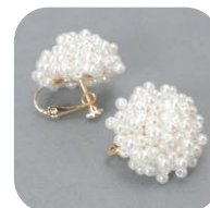
イヤリング 1191 P BigFl 価格：690円