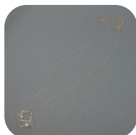
ネックレス CH 7061 2Sq 2CP GD 価格：390円 サイズ：全長47cm (モチーフ：W2.7×H2.7cm)