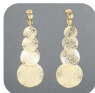
イヤリング Er 6081 Sand 4Ci 価格：590円