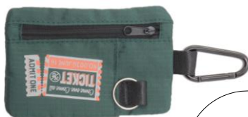
キー&コインポーチ Ticket