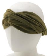
スエード ヘアバンド 価格：690円