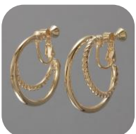
イヤリング 3002 2LineHoop GD 価格：590円