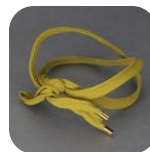
ワイヤーポニー各種 価格：各490円