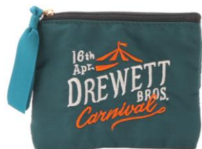
ティッシュポーチ GR