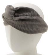
コーデュロイ ヘアバンド GY 価格：690円