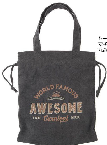
2wayコーデュロイトートバッグ NV