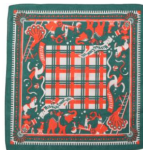
バンダナ (Cabaret, Carnival) 価格：各190円 大胆で迫力あるグラフィックが描かれたバンダナ。四隅のデザインにも拘り、結んだ時までおしゃれに仕上がります！