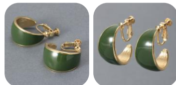
イヤリング 2002 EmMqHoop KA 価格：690円