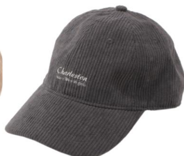
コーデュロイキャップ Charleston