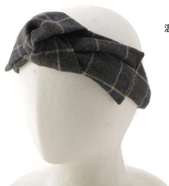
フランネルチェック ヘアバンド 価格：690円 温かみのあるフランネル生地ヘアバンド。 鮮やかなブルーラインが 配色のポイントとなっています。

温かみ溢れる素材のヘアバンドやバンダナなど、新作のファッションアイテム&アクセサリーをご紹介。デザインはもちろん、「AWESOME STORE」ならではの低価格帯も魅力です！