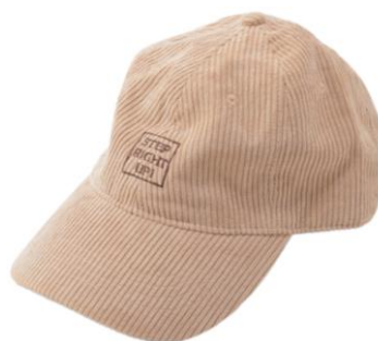
コーデュロイキャップ Step