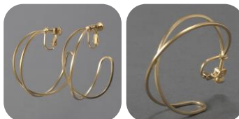
イヤリング 4002 CrossHoop L MGD 価格：690円