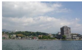
おごと温泉街 (湖上より)