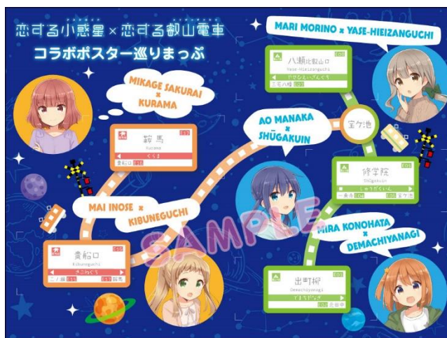
特典台紙（コラボポスター巡りまっぶ）のイメージ