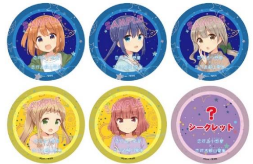
コラボ缶バッジのイメージ