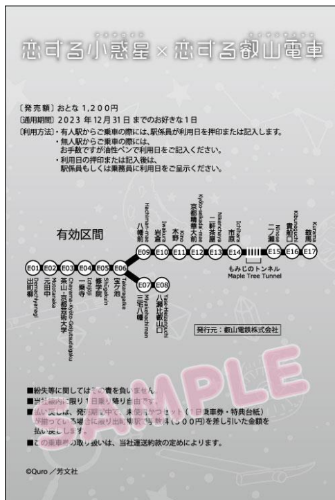
コラボきっぷのイメージ