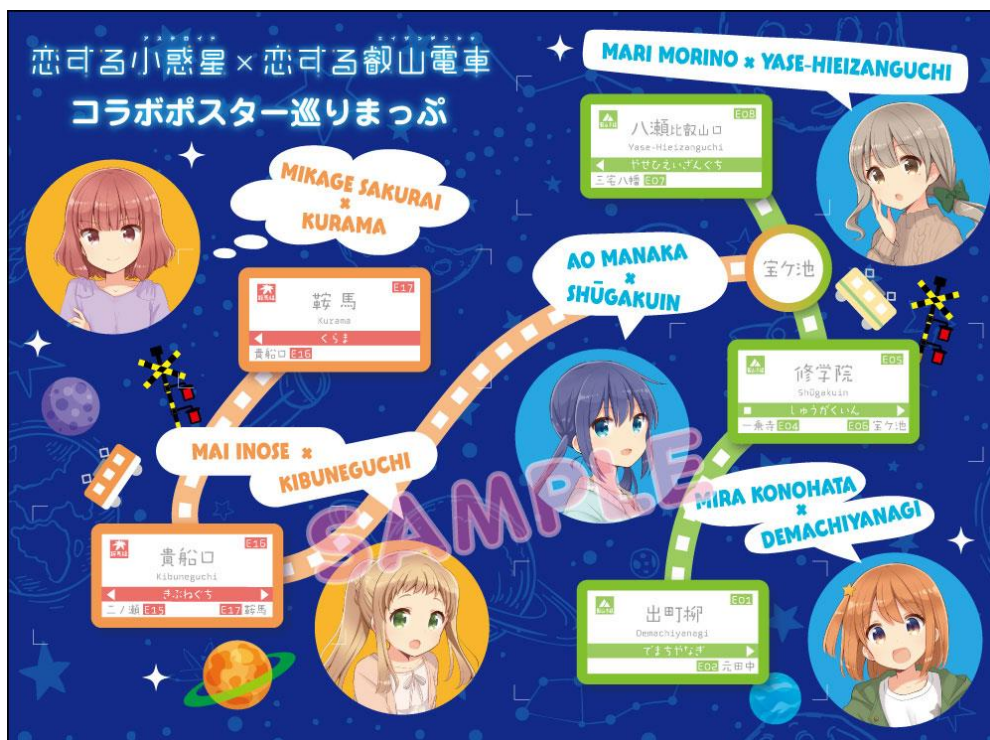
特典台紙 (コラボポスター巡りまっぷ) のイメージ