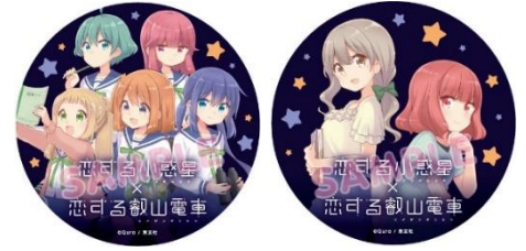
コラボヘッドマークのイメージ

※運転時間は日によって異なります。また、車両点検やその他の理由により運休や運行期間終了日を変更することがありますのであらかじめご了承ください。