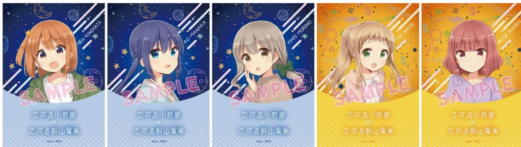
コラボポスターのイメージ