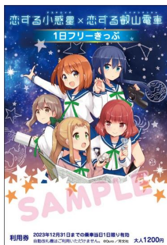
コラボきっぷのイメージ