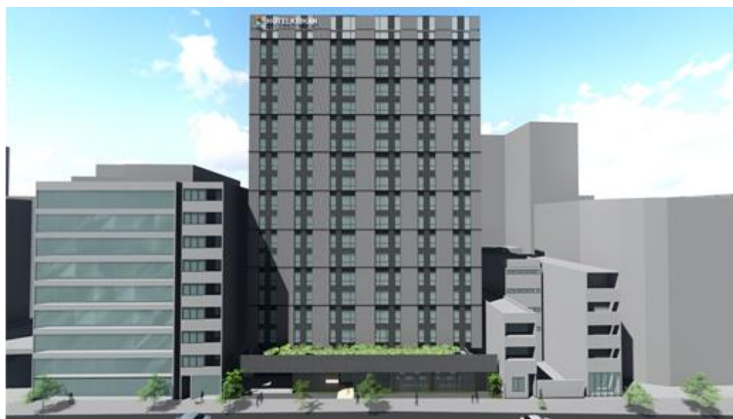
▲ホテル京阪 天満橋駅前（イメージ）