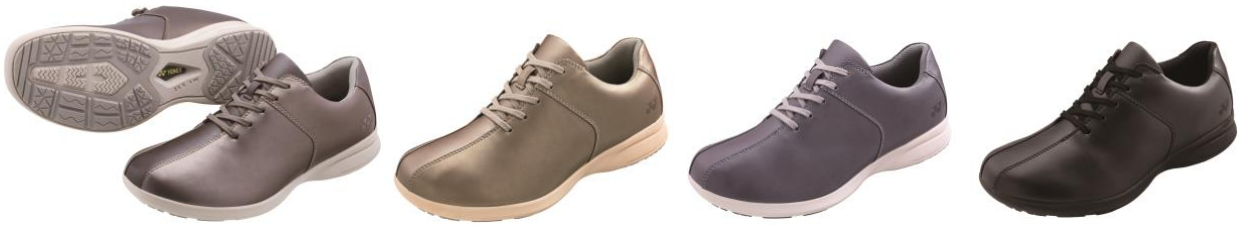
「パワークッションL122」左からグレイッシュパール、シャンパン、ラベンダー、ブラック