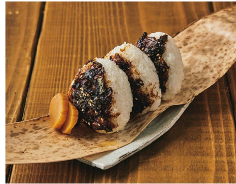
左／東洲斎写楽を招いた日のメニュー。「鰯の鮓煮」「こんにやく白和え」「小竹葉豆腐」「奈良漬」「昆布酒」 右／若き日のまだ貧しかった葛飾北斎を招いた日の一品。土産に用意した「ねぎ味噌にぎり」