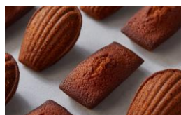
＜エシレ・パティスリー オ ブール＞ 洋菓子/焼き菓子 フィナンシェ・マドレーヌ