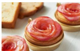
＜アップル&ローゼス＞ 洋菓子/りんごスイーツ

【新規出店スイーツブランド】 ※試験運用中のため出店店舗は変更になる場合があります。