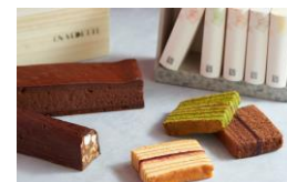
＜アン ヴェット＞ 洋菓子/焼き菓子