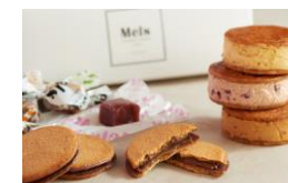
＜メルズ キャラメル ワークス＞ 洋菓子/キャラメルスイーツ