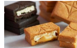
＜プレスバターサンド＞ 洋菓子/バターサンド