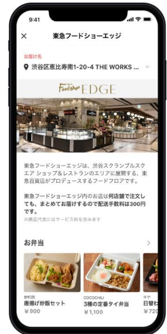
※「Chompy」の画面イメージです。

この結果を踏まえて、ランチと一緒にカフェタイムのスイーツを注文、話題の“デパ地下スイーツ”を気軽に食べ比べなど、より多様なシーンでご利用いただけるよう、スイーツ9店舗を新規に出店しました。スイーツは焼き菓子・半生菓子を取りそろえ、単品でも注文可能です。また一部の店舗ではオプションでショッピングバッグも注文可能なため、さらに便利にお使いいただけます。