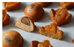
＜アトリエ アニパーサリー＞ 洋菓子/焼き菓子