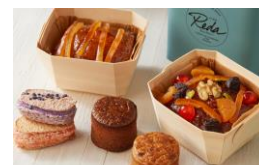
＜ペシェ・ミニヨン レイダー＞ 洋菓子/焼き菓子