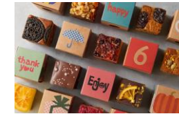
＜メロウウィッチ＞ 洋菓子/パウンドケーキ