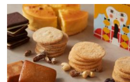
＜ナウオンチーズ＞ 洋菓子/チーズスイーツ