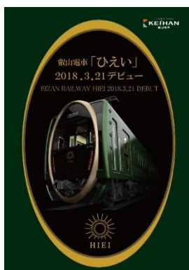
フラッグデザイン (イメージ)