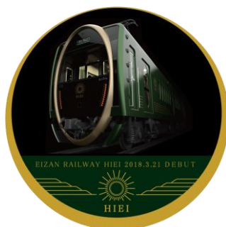
ヘッドマークデザイン (イメージ)

※運転時間は日によって異なります。また、車両点検やその他の理由により運休や運行期間終了日を変更することがありますのであらかじめご了承ください。