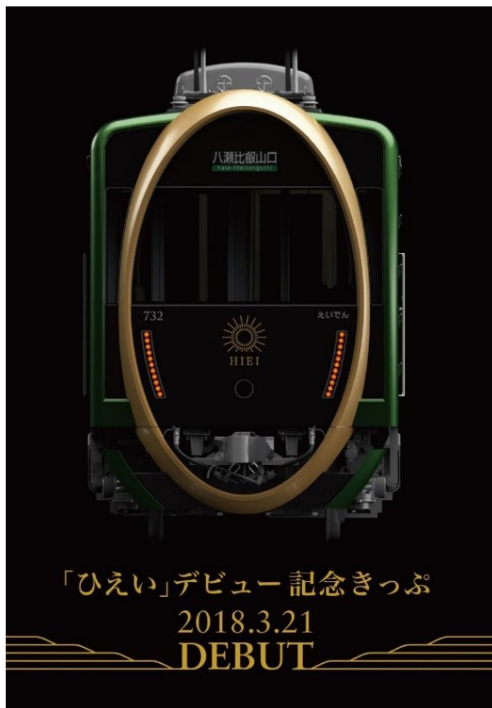
記念きっぷ台紙表紙のイメージ

叡山電車ホームページ「ひえい」特設サイト https://eizandensha.co.jp/hiei/