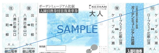
ガーデンミュージアム比叡入園引換券付往復乗車券のイメージ

今年は「ひえい」のデビューを記念して4月14日(土)～30日(月)に出町柳駅で「ガーデンミュージアム比叡入園引換券付往復乗車券」をお買い求めいただいたお客さまへ、幸運を呼ぶと言われている「四つ葉のクローバーの種」をプレゼントします。(プレゼントはガーデンミュージアム比叡の入園時に差し上げます)