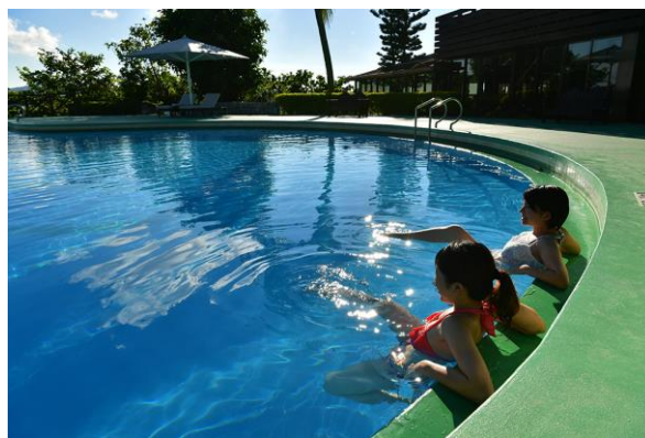
アクアピラティス

さまざまなおもてなしを上手に利用して、ゆったりと夏のバカンスをお楽しみください。