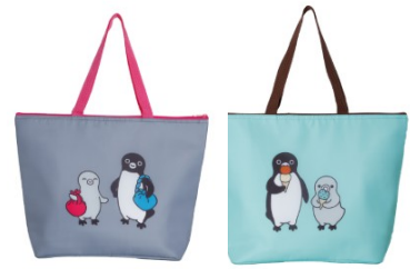
〈ピンクグレー〉 〈チョコミント〉

〈ピンクグレー〉は、ビビッドなピンクの持ち手とファスナーがポイント。風呂敷を持って仲良くショッピングするSuicaのペンギンが愛らしいデザインです。もうひとつは、明るいミントグリーンとブラウンの組み合わせが目を引き〈チョコミント〉。アイスクリームの絵柄とぴったりの色合わせです。2種類揃えて、その日の気分やコーディネートに合わせて使い分けるのもおすすめです。