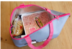
肉の大容量パックも