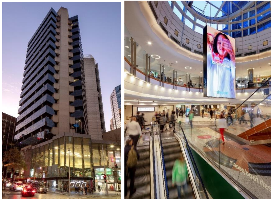
「60 Margaret Street」の外観（左）・内部（右）