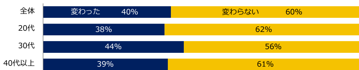
【図1】 コロナ禍を経験し、企業選びの軸は変わりましたか？

「コロナ禍を経験し、企業選びの軸は変わりましたか？」と伺うと、40%が「変わった」と回答しました。年代別に見ると「30代」（44%）が「変わった」と回答した割合が最も高いことがわかりました。