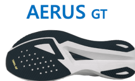
前足部の接地面積を増大

ヨネックス最軽量ミッドソール素材「フェザーライトエックス」をミッドソール下層に採用。長距離走行のエネルギーロスを軽減し、軽やかな走行感を実現。