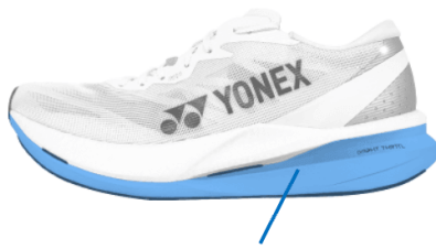
FEATHER LIGHT X

ヨネックス最軽量ミッドソール素材「フェザーライトエックス」をミッドソール下層に採用。長距離走行のエネルギーロスを軽減し、軽やかな走行感を実現。