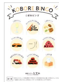
ビンゴカードイメージ