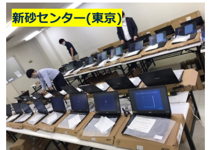
新砂センター(東京) 〒136-0075 東京都江東区新砂1-12-39 日本通運株式会社 新砂2号倉庫4階