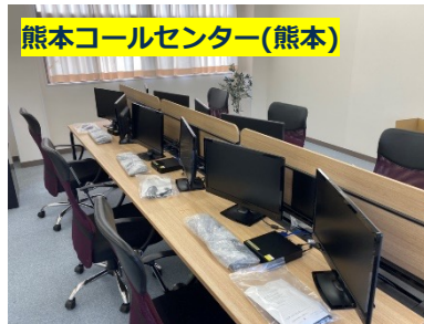
熊本コールセンター(熊本) 〒862-0959 熊本県熊本市中央区白山1-2-13 白山一丁目ビル4F

※2：文科省公開資料 「GIGA スクール構想における高等学校の学習者用コンピュータ等のICT環境整備の促進について」 https://www.mext.go.jp/content/202103012-mxt_jogai01-000011648_002.pdf