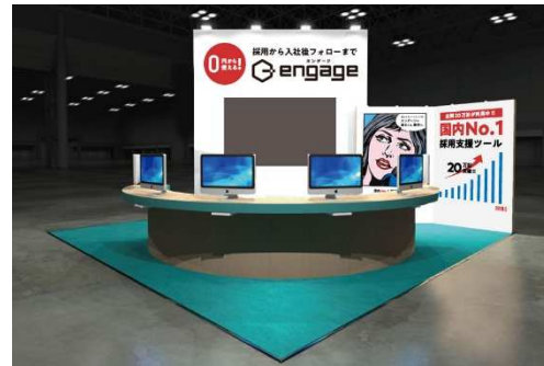
※『engage』出展ブースイメージ