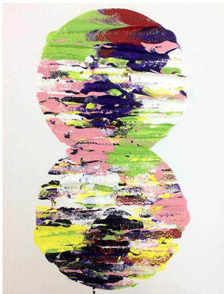
「untitled」 410×320mm アクリル・カーボランダム・綿布 2015年