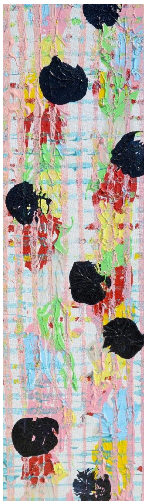
「作品名未定 (Name me!)」

仲間とルーズに過ごすホテル「星野リゾート BEB5 軽井沢」は、セゾン現代美術館(長野県・軽井沢町)とのコラボ企画「Name me!」を2019年8月7日～10月30日に開催します。ホテル内を彩る作品には作品名がまだなく、見る人が自分で好きな名前をつけてインスタグラムに投稿する企画です。作家が最も気に入ったものが正式な作品名になります。