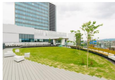
「ステーションヒル枚方」外観