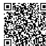
応募フォーム QR コード