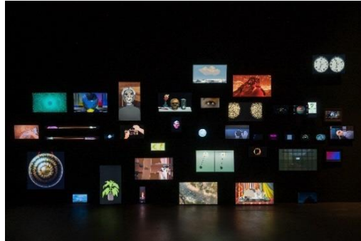
《T for Time: Timepieces》2023