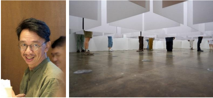
《Planetary Seed》2024

タイ・チュラロンコン大学建築学部卒業。現代技術を用いて、建築と彫刻を融合させた作品を制作している。芸術的な探求の他に、彼は熱心なサイクリストであり、長距離パドラーでもある。2014年に長距離サイクリング・ネットワークを設立し、車や列車を使わずにタイ全土の農村地域を巡る旅を実施する。この経験によって得た、前近代の風景、社会、文化と現代のタイの風景に関する視点は、近年の芸術活動に影響を与えている。