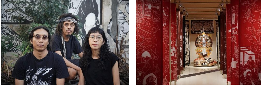
《Bloom in Agony》2022