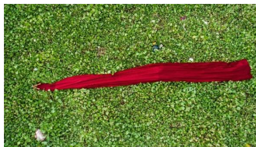
《Mother of River》2022