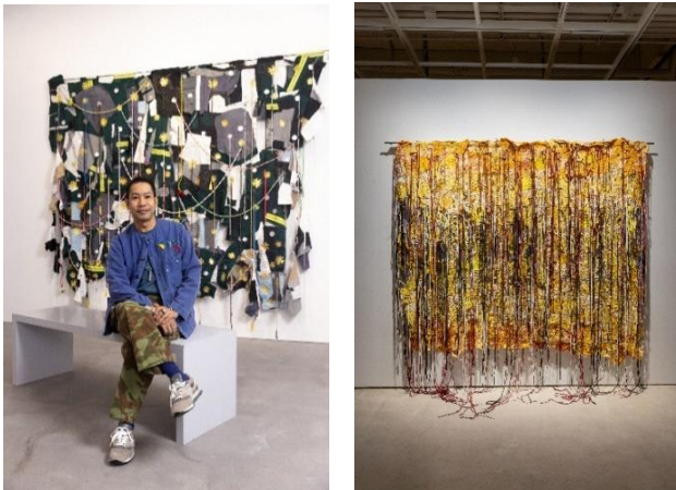
《Airborne (Phra Nakorn)》

織物や刺繍を用いた作品を中心に制作するほか、観客参加型のインスタレーションも手掛けるアーティスト。タイでは言及されない非公式の歴史や、個人的かつ地域的な歴史の交差、さらに近年はマイノリティに対する民族主義的差別が引き起こす紛争に関心を寄せている。そのような主題と、繊細な形態と素材の表現を対比させることで、現在進行中の微妙な緊張関係を浮かび上がらせている。