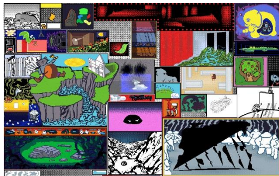
《Empty Tomb》2024

幅広い媒体を通して歴史と文化メディアの繋がりを探求するタイ人現代アーティスト、キュレーター。神話や伝説を、ビデオゲーム、コミック、映画などから引用したポップカルチャーと融合させることで、歴史の理解と学びの再構成についてテクノロジーが果たすべき役割を検証している。モンクット王工科大学ラートクラバン校で映画学とデジタルメディアを専攻。