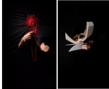
《Voice and Noise》2023