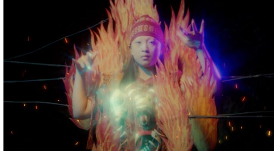
《Garden Amidst the Flame》2022

ジョグジャカルタとジャカルタを拠点に活動し、主にフィクションを用いて「造られた恐怖」にまつわる歴史や神話を考察し、それらを物語として伝える作品を制作している。既存の制度の視点からではなく、追放された存在や、ささやかで個人的な闘いに注目し、今とは異なる未来の可能性を探求している。