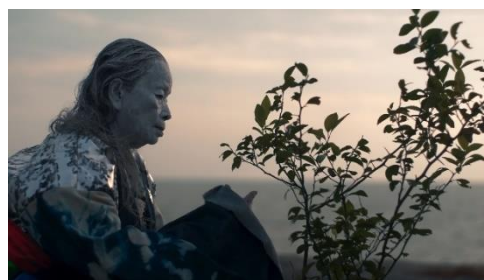
《Songs for dying》(still), 2021 Co-commissioned by the 13th Gwangju Biennale, Han Nefkens Foundation and Kunsthall Trondheim.

1986年生まれ。ニューヨークとバンコクを拠点に活動するビジュアルアーティスト、映像作家、ストーリーテラー。アジアとアメリカでの多彩な活動を通して、文化移植やその混成性に埋め込まれた物語を伝えている。その作品群は、フィクションと詩を融合させ、さまざまな題材に関わる共感的体験を提供しており、主に家族、友人、同僚の生活や土地の神話などを主題とした作品を制作している。