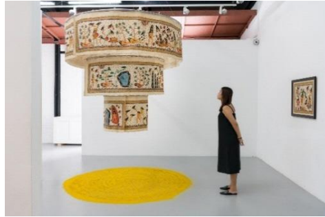
《Ode to the Sun》2020

バリ島出身の現代アーティスト。バリ島の芸術や文化にまつわる神話や誤解を解き明かすことに重点を置いた作品制作を行う。芸術的活動を通して、社会的ヒエラルキーにおける女性の立場に疑問を投げかけ、ジェンダーの規範的な構成概念を覆すことに取り組んでいる。