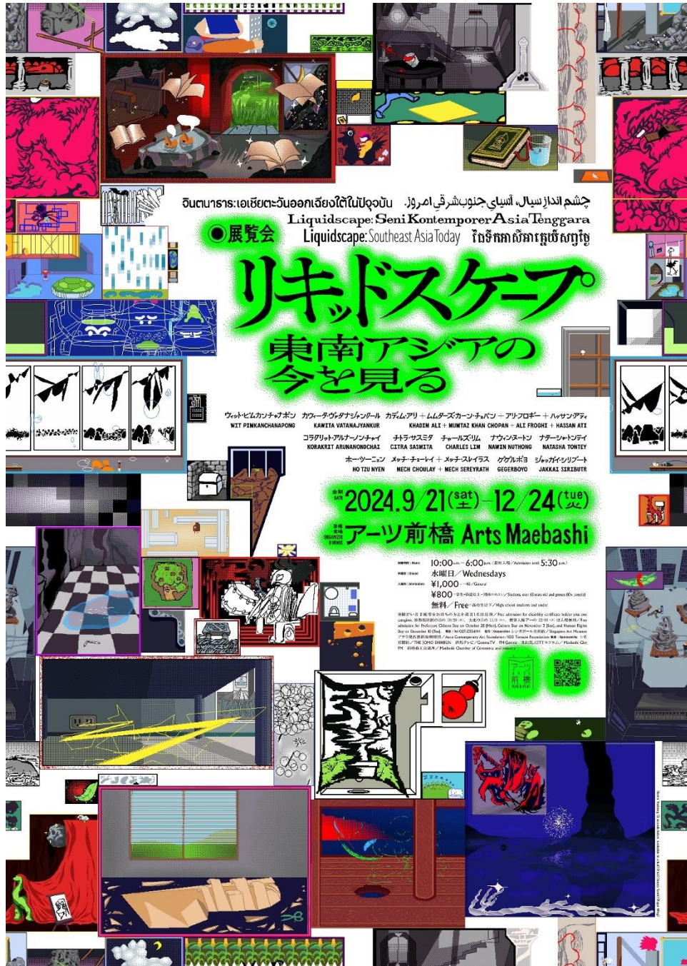
Nawin Nuthong 《2 sec before revolution in a leaf》《Flux》《Empty Tomb》《Paper Wing》