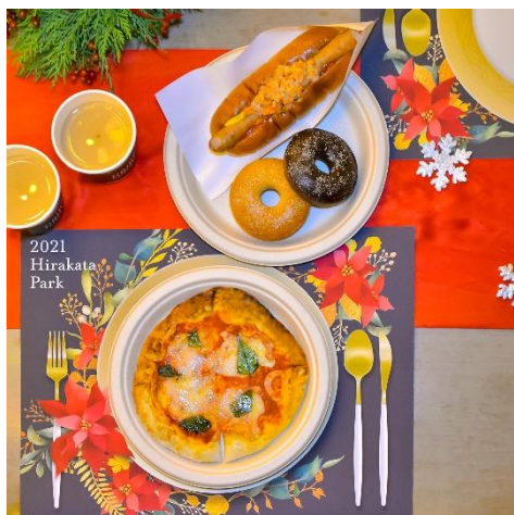
食事からスイーツまで楽しめるフードメニュー

また、2021年12月27日(月)から2022年1月10日(月・祝)の期間は装いを新たにし、引き続き「フードカーニバル」を開催いたします。