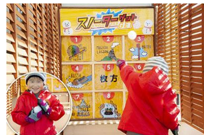
スノーターゲット