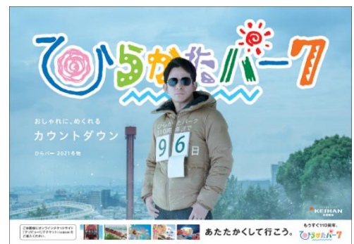
「2021年度 冬シーズン」ビジュアル

また、これらのオープンにあわせて「2021年度 冬シーズン」のビジュアルを2021年11月29日(月)から京阪電車沿線等で順次公開いたします。