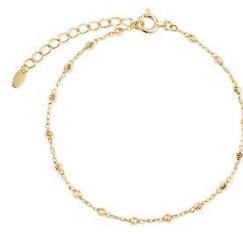
『グリッド / ブレスレット』 K18 イエローゴールド