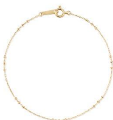
『シアー / ブレスレット』 K10 イエローゴールド