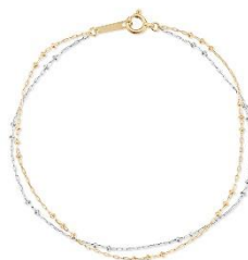
『バイカラー / ブレスレット』 K10 イエローゴールド×プラチナ 850