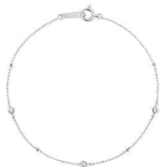
『ステーション / ブレスレット』 プラチナ 850、ダイヤモンド