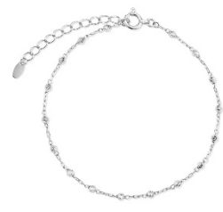
『グリッド / ブレスレット』 プラチナ 850