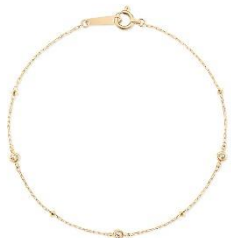
『ステーション / ブレスレット』 K10 イエローゴールド、ダイヤモンド

ラインナップは、K18 製、K10 製、プラチナ 850 製、メレダイヤモンド付きなどバリエーション豊富に展開。繊細なチェーンや異なる素材の組み合わせにより、カジュアルからエレガントなスタイルまで幅広い装いに輝きを添えます。ケイウノならではのポイントとして、ご希望により留め具部分へ無料で刻印が可能で、イニシャルや記念日など大切な想いをさりげなくこめることができます。身につけたときにふと目に入るブレスレットは、自分へのご褒美や大切な方への贈り物としても最適なアイテムです。