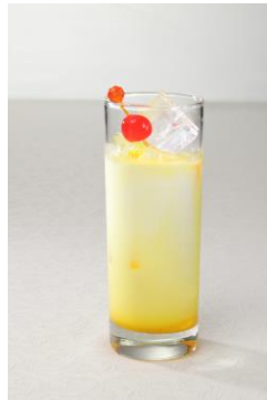
緑輝の いえろーコントラバス