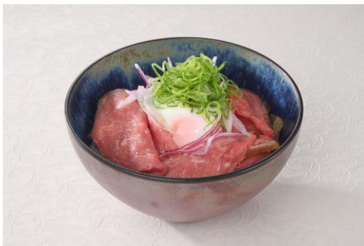
・OGのオージービーフ丼 1,700円