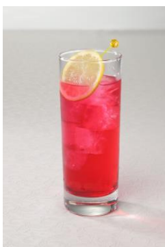
久美子の れっどユーフォニアム