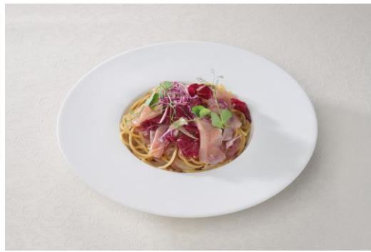
・麗奈の和風パスタ 1,400円