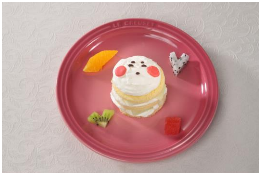
・チューバくんのフルーツケーキ 1,400円