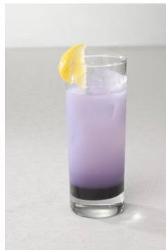
麗奈の ぱーがるトランペット