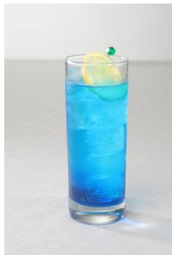
葉月の ぶるーチューバ