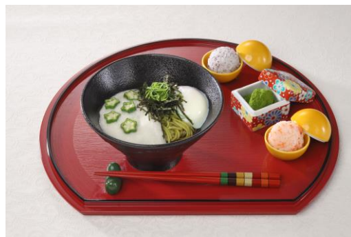
・真由のふわとろ☆多茶そば 1,450円