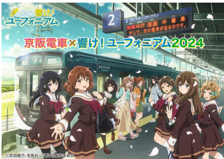
「京阪電車×響け！ユーフォニアム 2024」オリジナル描き下ろしイラスト

なお、席数に限りがあるためご利用にあたっては事前にご予約が必要です。 詳細は以下の通りです。