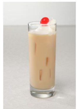
真由の ほわいとユーフォニアム