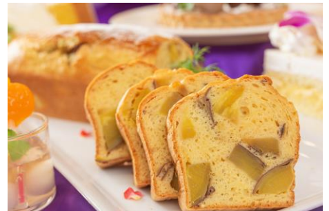
さつま芋のパウンドケーキ