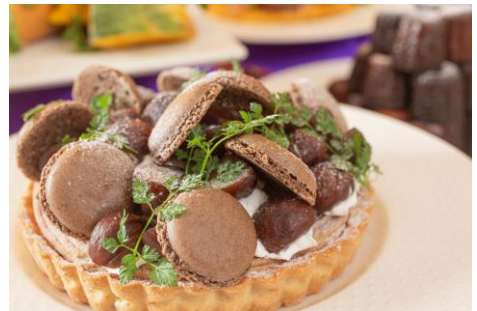
モンブランタルト