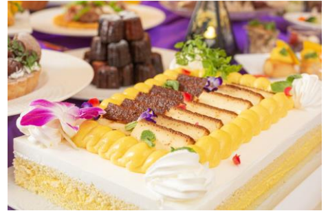
カボチャプリンのショートケーキ