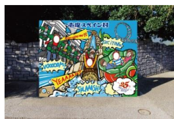
25th アニバーサリー 顔出しパネル