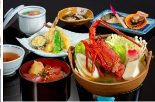
伊勢志摩産 伊勢海老長寿鍋御膳 (数量限定)