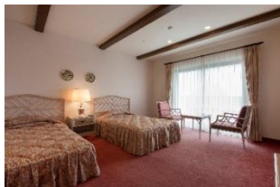
スタンダードツインルーム

パーク、温泉に隣接し、お得なパスポートの販売、温泉入浴の無料などのホテル特典も充実し、Wi-Fi 無料通信サービスを全館完備。インテリアの隅々までこだわった 40.5 m 2 のゆったりしたスタンダードツインルーム、キャラクタールーム、1部屋に6名様までご宿泊いただけるファミリールームに、本格的なスペイン料理や日本料理のコース料理、小さなお子様でも利用しやすいファミリーバイキングで多種多様なお客様の要望に合わせたプランをご用意しております。南スペインの面影漂うホテルロビーでは上演日限定でフラメンコショーが開催され、まるでスペイン旅行をしたかのような優雅で非日常なひとときをお過ごしいただけます。