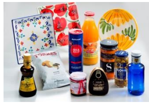
スペインから直輸入 の様々な輸入食品等