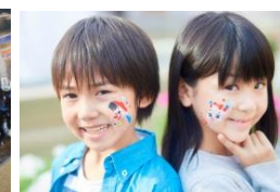
「フェイス &ボディペインティング」