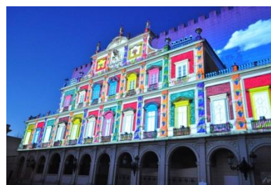
プロジェクションマッピング新作映像 ※画像はイメージ