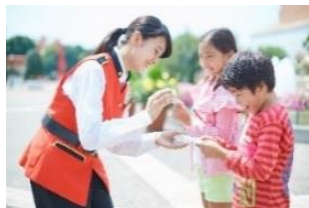
「オラ！スタンプラリー」

「オラ！スタンプラリー」のプレゼントや「フェイス&ボディペインティング」に25thアニバーサリーデザインが登場いたします。