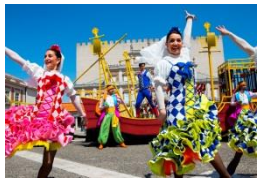
「バイレ・デル・カピタン」