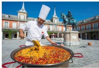
「大鍋パエリア」の販売