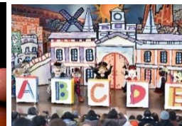
「ドンキホーテの アー・ペー・セー・デー・エスパーニャ！」