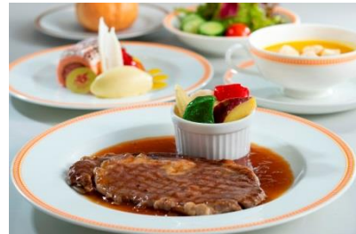
25th アニバーサリーランチメニュー