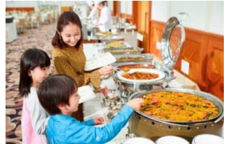
ファミリーバイキング