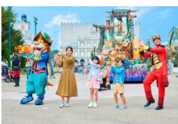
「エスパーニャカーニバル “アデランテ”