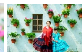
「おでかけフラメンコ」