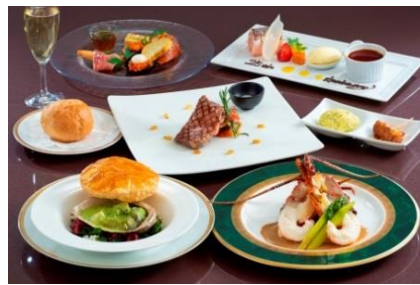
25th アニバーサリーディナーメニュー(洋食)