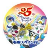
25th アニバーサリー オリジナル缶バッジ