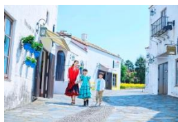
「サンタクルス通り」

季節折々の花々や美しい街並みはどこを切り取ってもインスタ映えし、友だちや家族とシェアしたくなる写真がお撮りいただけます。また、テーマパーク気分が盛り上がるフェイス&ボディペインティング、フラメンコ衣裳に着替えてスペイン気分が満喫できる「おでかけフラメンコ」など、志摩スペイン村でしかできない体験を思い出にさせていただきます。