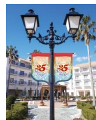
25th アニバーサリー フラッグ装飾