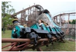
「グランモンセラー」