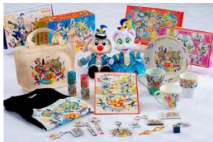
25th アニバーサリー キャラクターグッズ

キャラクターのぬいぐるみやステーションナリーなどのキャラクターグッズ、キャラクター菓子に約50種類の25thアニバーサリー新商品が登場。また、日用品からファッション、食料品まで個性豊かなスペイン雑貨を取り揃え、シーズンごとに変わるテーマと新商品でいつご来園いただいても新しい発見があります。