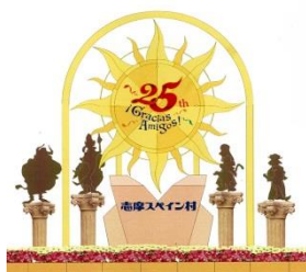
25th アニバーサリー モニュメント

25th アニバーサリーモニュメント、インスタ映えする新フォトスポット、思わず顔を出したくなる顔出しパネルが登場いたします。25th アニバーサリーのフォトロケーションで友だちやご家族といっしょに記念撮影をお楽しみください。