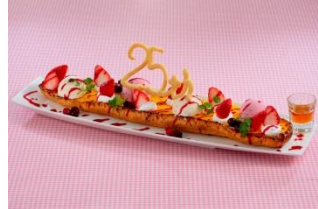
「25th」にちなみ2,500円で登場！ 「莓のロングフレンチトースト」