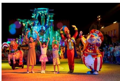
ナイトパレード 「エスパーニャカーニバル “アデランテ”」

プロジェクションマッピングに新作映像が登場し、幻想的なナイトパレード、ムーンライトフィナーレへと続くナイトスペクタクル「フェスティバル フェスティバル」が、25th アニバーサリーにふさわしく、よりフェスティバルにリニューアルいたします。