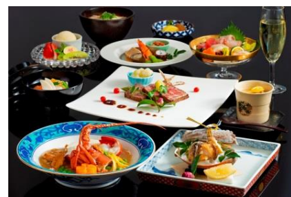
25th アニバーサリーディナーメニュー(和食)