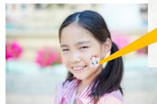
「フェイス&ボディペインティング」