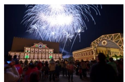
花火と音楽の競演 “ムーンライトフィナーレ”

※ナイトスペクタクルは、7月13日(土)、14日(日)、20日(土)、21日(日)、7月27日(土)～8月31日(土)も上演いたします。