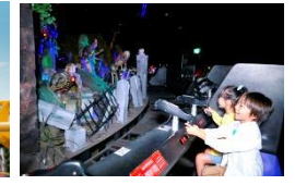
「アルカサル の戦い “アデランテ”」