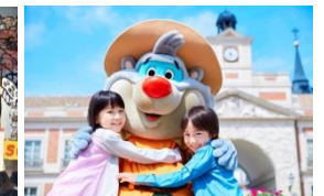
「キャラクターグリーティング」