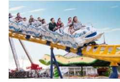
「キディモンセラー」