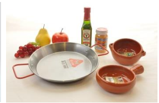
スペイン料理に欠かせない 陶器食器や鍋