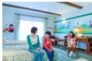
キャラクタールーム