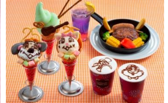
25th アニバーサリー キャラクターメニュー