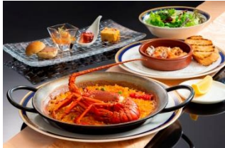
伊勢志摩産 伊勢海老パエリアセット (数量限定)

伊勢志摩の青い空、青い海、輝く太陽が生み出す伊勢志摩の幸に感謝して、伊勢志摩産の伊勢海老を使ったパエリアや日本料理、「25th」にちなみお得な2,500円メニューが登場。その他にも春限定メニューやキャラクターをモチーフにした25thアニバーサリーメニューが登場いたします。