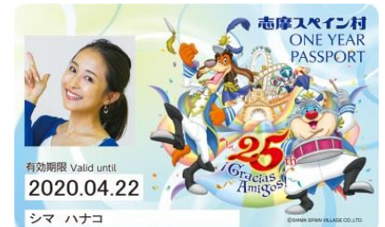
25th アニバーサリーデザインの年間パスポート