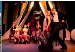
「エントレ・ドス・アグアス」 ※イメージ