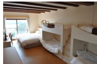
ファミリールーム