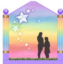
新フォトスポット エスパルニャ通り