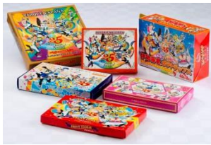
25th アニバーサリー キャラクター菓子