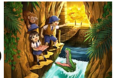
イメージビジュアル