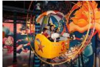
ピエロ・ザ・サーカス 「空中サーカスアドベンチャー」