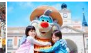
「キャラクターグリーティング」