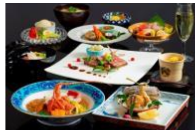
プレミアム和会席料理