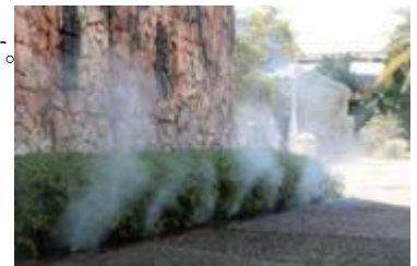
クールミストスポット

【増設場所】 フィエスタ広場 3カ所 シベレス広場 1カ所 サンクルス通り 2カ所 コロンブス広場 1カ所