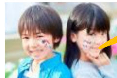
「フェイス&ボディペインティング」