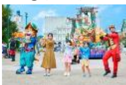
「エスパーニャカーニバル “アデランテ”」

⑦期間限定ストリートパフォーマンス【上演期】7月13日(土)、14日(日)、20日(土)、21日(日)、7月27日(土)～8月31日(土)