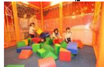
ピエロ・ザ・サーカス 「サーカスハウス」