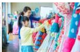
「おでかけフラメンコ」