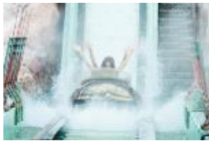
「スプラッシュモンセラー」

スリルと清涼感溢れる急流すべり「スプラッシュモンセラー」や、氷点下の世界を歩いて体感できる「氷の城」、夏の日差しを避けて涼しい屋内で楽しめるシューティングアトラクション「アルカサル」の戦い“アデランテ”、ヨーロッパの移動遊園地をモチーフした「ピエロ・ザ・サーカス」、スペインの情熱と熱気を大迫力の映像で体感できる「カンブロン劇場」などで夏を涼しく快適にお楽しみいただけます。大量の水でパワーアップした水遊び場「ジャブジャブラグーン」、新たに増設したクールスポットと合わせて志摩スペイン村の夏をお楽しみください。