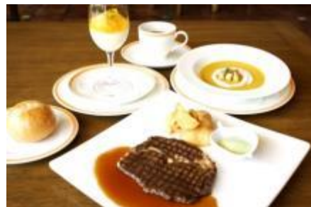
25th アニバーサリーサマーランチ