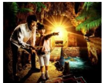
「メイズ 25～黄金王からの挑戦状～」