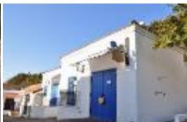
新フォトスポット「サンタクルス通り」