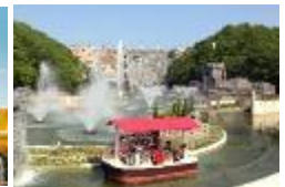
「フェリスクルーズ」