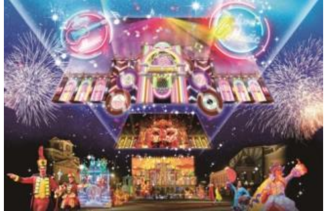
ナイトスペクタクル 「エスティバル フェスティバル～真夏のフェスティバル～」