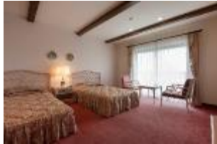
40.5㎡のゆったりした スタンダードツインルーム

パーク、温泉に隣接し、お得なパスポートの販売、温泉入浴の無料などのホテル特典も充実し、Wi-Fi 無料通信サービスを全館完備。様々な客室タイプや本格的なスペイン料理、日本料理のコース料理、小さなお子さまでも利用しやすいファミリーバイキングなど、お客様の要望に合わせた宿泊プランをご用意しております。まるでスペイン旅行をしたかのような優雅で非日常なひとときをお過ごしいただけます。