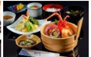
伊勢志摩産 伊勢海老浜焼き御膳 (数量限定)