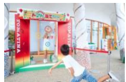
「トマト当てゲーム」