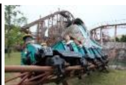
「グランモンセラー」