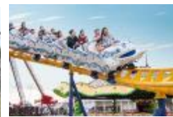
「キディモンセラー」