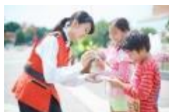
「オラ!スタンプラリー」