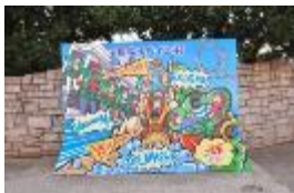
25th アニバーサリー 顔出しパネル

季節折々の花々や美しい街並みはどこを切り取ってもインスタ映えし、友だちや家族とシェアしたくなる写真がお撮りいただけます。また、テーマパーク気分が盛り上がるフェイス&ボディペインティング、フラメンコ衣裳に着替えてスペイン気分が満喫できる「おでかけフラメンコ」など、志摩スペイン村でしかない体験を思い出に思い出していただけます。