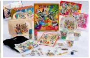
25thアニバーサリー キャラクターグッズ・菓子