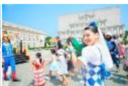
「バイレ・デル・カピタン」夏Ver.