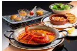
伊勢志摩産 伊勢海老パエリアセット (数量限定)