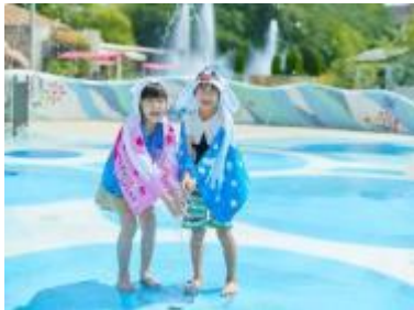
25th アニバーサリー夏期限定 「ジャブジャブラグーン」