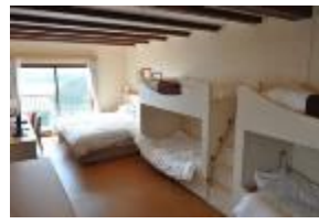
1部屋に6名様までご宿泊可能 ファミリールーム