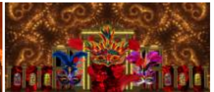
新作プロジェクションマッピング 「太陽・月 ラブソディア」