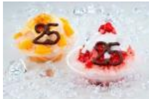
ふんわり食感 25thアニバーサリーかき氷

「25th」にちなみ、「25」種類の具材にこだわった高さ 50 cmのビッグパフェや暑い夏にぴったりのふんわり食感が楽しめるかき氷が、25周年の夏限定で登場いたします。また、伊勢志摩の青い空、青い海、輝く太陽が生み出す伊勢志摩の幸に感謝して、伊勢志摩産の伊勢海老を贅沢に炊きこんだパエリアや伊勢志摩の豊かな海の味覚をふんだんに味わう日本料理など伊勢志摩の幸にこだわったメニューも登場いたします。