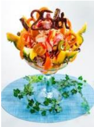
25種類の具材にこだわり 25thアニバーサリー びっくりパフェ (数量限定)

「25th」にちなみ、「25」種類の具材にこだわった高さ 50 cmのビッグパフェや暑い夏にぴったりのふんわり食感が楽しめるかき氷が、25周年の夏限定で登場いたします。また、伊勢志摩の青い空、青い海、輝く太陽が生み出す伊勢志摩の幸に感謝して、伊勢志摩産の伊勢海老を贅沢に炊きこんだパエリアや伊勢志摩の豊かな海の味覚をふんだんに味わう日本料理など伊勢志摩の幸にこだわったメニューも登場いたします。