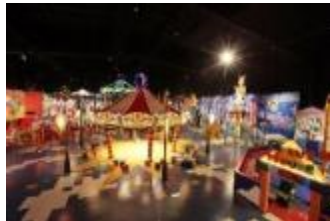
「ピエロ・ザ・サーカス館内」