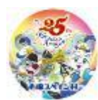
25th アニバーサリー オリジナル缶バッジ