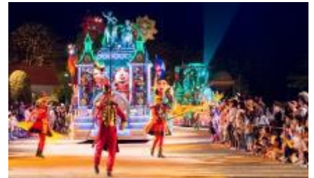
ナイトパレード 「エスパーニャカーニバル “アデランテ”」

華やかなイルミネーションに彩られたフロートとともに、情熱的なエンターテイナーと一緒に盛り上がります。昼間のパレードとは違い、情熱的で華やかなナイトパレードが鮮やかに夜のパークを彩ります。