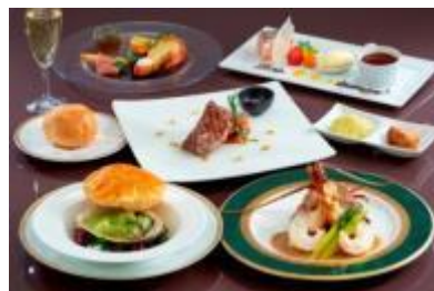
プレミアムスペイン風コース料理