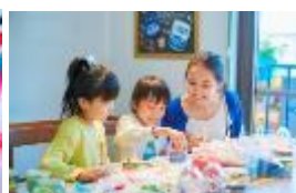
マノノ「キャンドル体験」