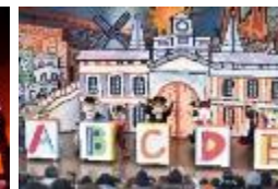
「ドンキホーテの アー・ペー・セー・デー・エスパーニャ！」