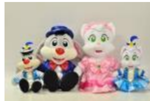
25thアニバーサリー キャラクターぬいぐるみ