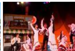
「エントレ・ドス・アグアス」