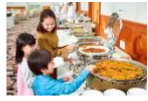
ファミリーバイキング