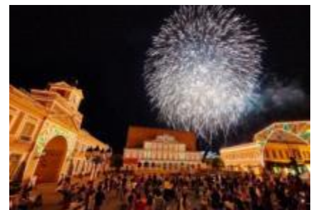
花火と音楽の競演「ムーンライトフィナーレ」

25周年を祝い、音楽がよりフェスティバルに。フィエスタ（祝祭）を告げる音楽が響き渡り、夜空いっぱいに広がる迫力の花火がクライマックスを飾ります。