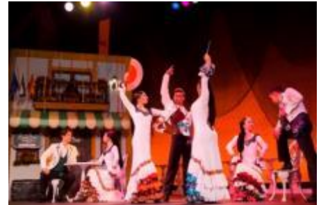
新フラメンコショー「エントレ・ドス・アグアス」