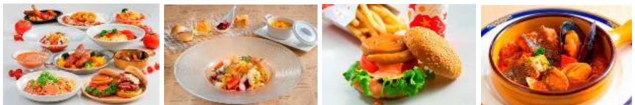
トマトを使った新メニュー ※イメージ