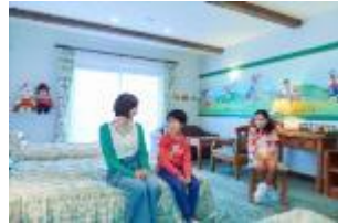
キャラクタールーム