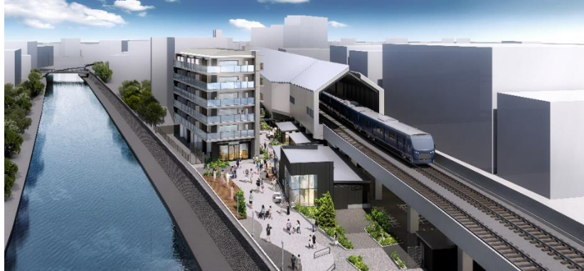
星天qlay Eゾーン イメージ