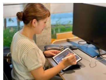
展示作品の制作風景