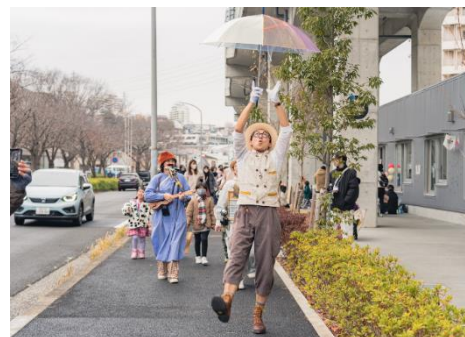
昨年のパフォーマンス風景

星天 qlay ウェブサイト: https://www.hoshiten-qlay.com/