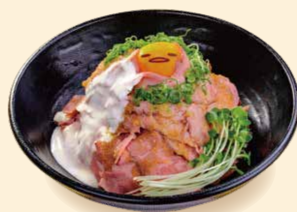
●コラボメニュー(一例): しきぶんとしは合格かな～ ローストビーフ丼～エベレスト盛り～ 1,380円+税

レストランでぐでたまのコラボメニューを5種類販売! コラボメニューをご注文の方にはコラボ限定オリジナルコースターをプレゼントします。(全6種類) さらにコースターの裏面のQRコードからアクセスすると、オリジナル待ち受け画像もプレゼント!(全種類共通となります) ※コースターは1メニューにつき、1枚配布。種類はお選びいただけません。