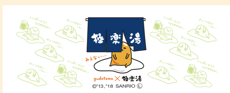
●オリジナルグッズ(一例):ぐでたまオリジナルフェイスタオル(4種類)430円+税 ※画像はイメージです。