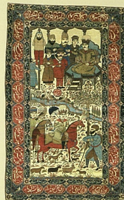
モフタシャム カシャン、ペルシア中央部 1900年ごろ