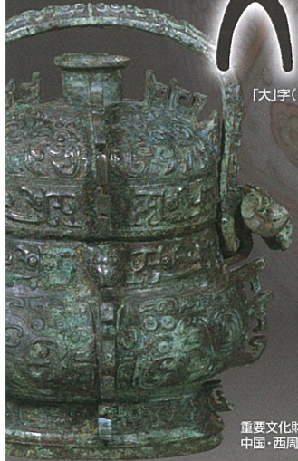
重要文化財 「象文直(臣辰直)」 中国・西周時代