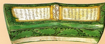
「三彩詩文枕」 中国・金時代