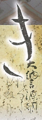
「彩色紙/岡寺切(順集)」 藤原定信筆 日本・平安時代 部分 展示期間：9/25～10/20