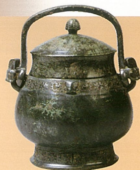
「四升花文帯卣」 中国・殷(商)時代

当白鶴美術館には、種々の漢字の姿を示す優品が数多く所蔵されています。悠久の中国史を体現する約3000年前の金文を鑄込む青銅器、国宝「賢愚経」・「大般涅槃経集解」に代表される荘厳な仏語を写す奈良時代の経巻、平安時代の雅な歌を仮名交りで詠む色紙、意匠化した文字によって吉祥を讃える陶磁器などです。本展覧会では、こうした作品を通して、主に書される場に応じた漢字造形の移ろいを辿り、豊かな広がりを見せる文字世界を提示します。