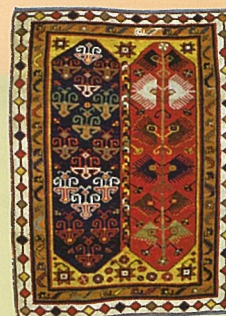
メグリ、アナトリア西部 1850年ごろ

今回は絨毯上に反復される図形や記号化した図像、そして文字の形などに注目してみます。